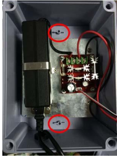
รูปที่ 2 แสดงตำแหน่งการเจาะยึด Fig.2 Position to fix with panel