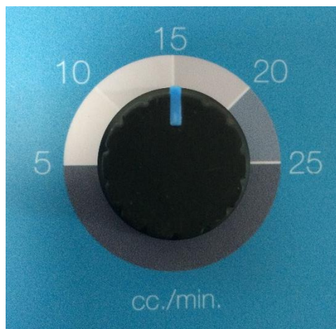
รูปที่ 5 แสดงปุ่มปรับการตั้งค่า 5.00 – 25.00 ซีซี/นาที

NOTE: Chlorine solution must be full in tubes before start