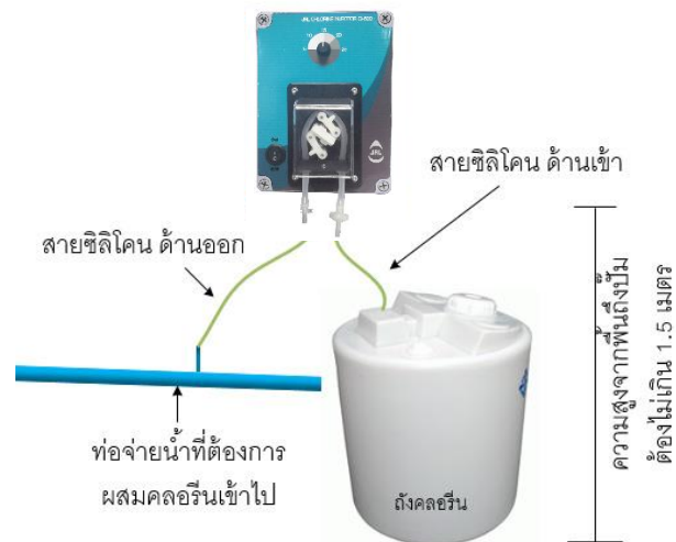
รูปที่ 1 แสดงวิธีการติดตั้งเครื่อง CL-500 Fig.1 Installation Diagram